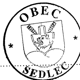
Příjemce Obec Sedlec František Kos

Přílohy: Příloha č. 1 - Plánovaný nákladový rozpočet